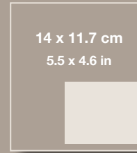
1/4 PÁGINA 1/4 PAGE