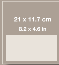
1/2 PÁGINA 1/2 PAGE