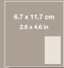
1/6 PÁGINA 1/6 PAGE

FORMATO DIGITAL: TIFF, JPG, PDF, en alta resolución (300 dpi). REBASE: Añadir 5 mm por lado.