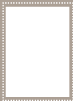
1 PÁGINA FULL PAGE

Todos los anuncios son publicados en Inglés y están sujetos a la aprobación de los editores.