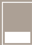
1/3 PÁGINA 1/3 PAGE